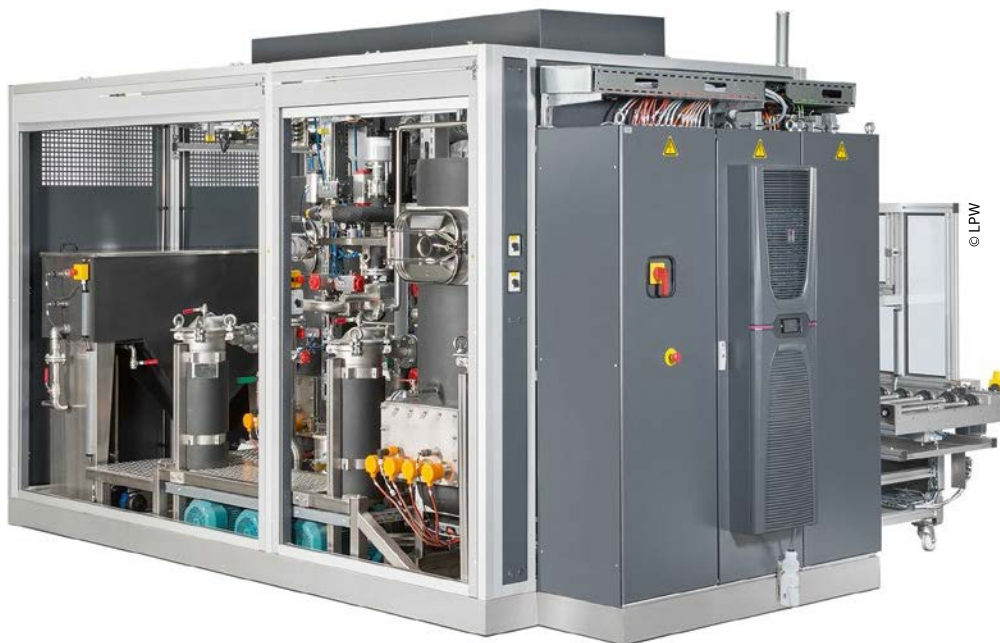
Moderne modulare Kammeranlagensysteme erlauben die Integration der am Markt bekannten sowie neuer Reinigungs- und Trocknungsverfahren für filmische und partikuläre Aufgabenstellungen.

gungen und Prozesse aktiv mit einbezogen.