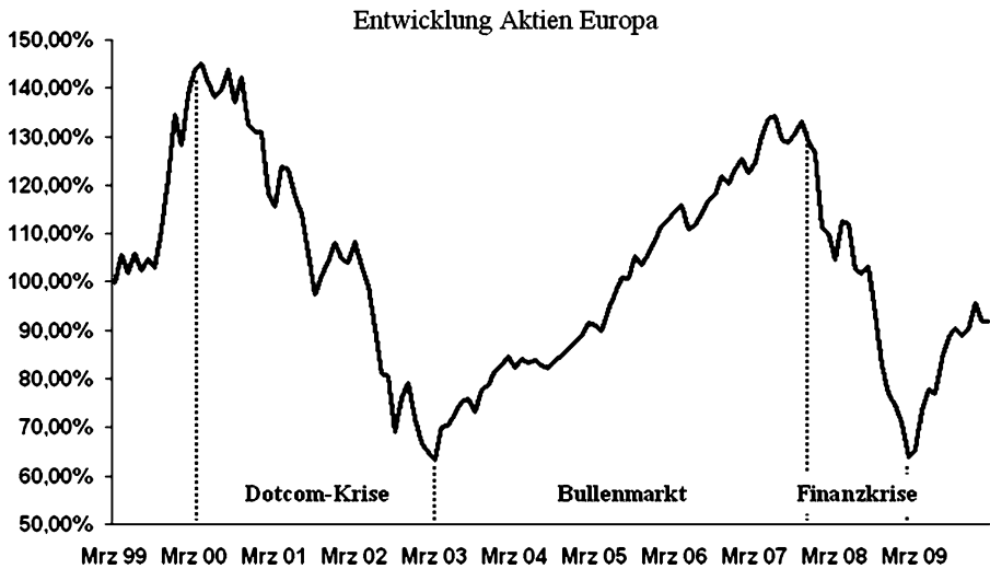
Abb. 2 Schematische Darstellung der Unterteilung des Analysezeitraums am Beispiel der Entwicklung des EURO STOXX 50 – Total Return Index.

werden zusätzlich zwei Bärenmärkte (Dotcom-Krise, 2 Finanzkrise 3 ) und ein Bullenmarkt 4 isoliert betrachtet. Abbildung 2 illustriert die zeitliche Abfolge der Phasen.