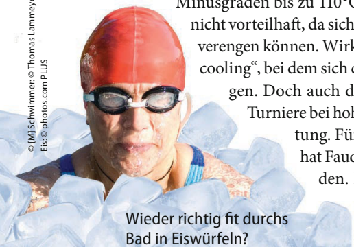
Wieder richtig fit durchs Bad in Eiswürfeln?